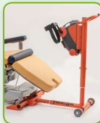
Adattamento in altezza / Adaptation in height

L'idea di posizionare la poltrona sul telaio, assicura grande stabilità all'intero dispositivo, evitando al paziente sgradevoli sensazioni di instabilità durante la pedalata.