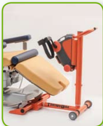
Adattamento in lunghezza / Adaptation in length

Con alcune semplici operazioni assistite si adatta alla persona, pronta per l'uso. It's adaptable to most kind of chairs through friendly operations.